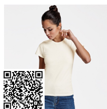
BASSET WOMAN CA6686